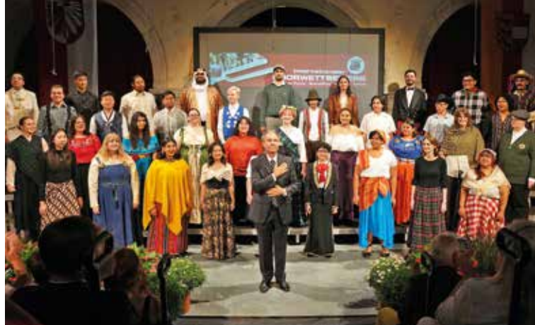
Mt. San Antonio College Chamber Singers aus Kalifornien (USA)