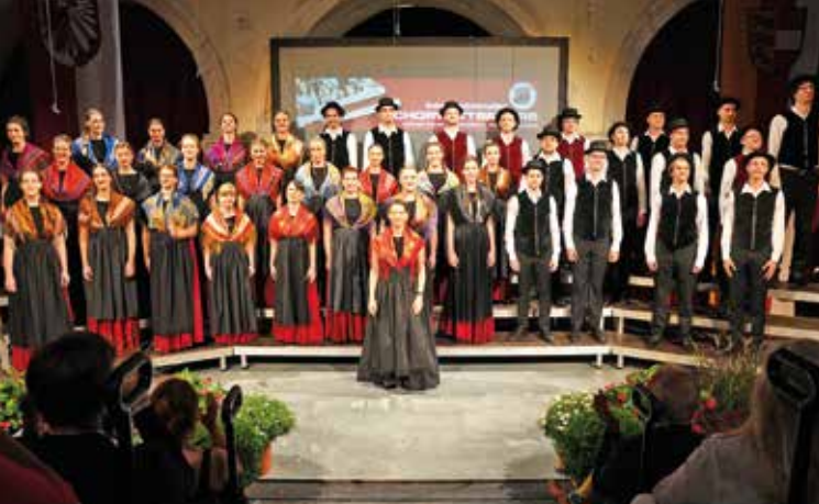
Akademischer Chor Tone Tomšič der Universität Ljubljana (SLO)