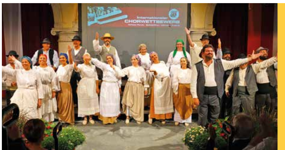
Chor Camerata Lacunensis von den Kanarischen Inseln

Nach vier Tagen mit unterschiedlichsten Klängen und faszinierenden Choreografien standen die Sieger fest: Mit dem Gewinn des Volksliedbewerbs und des Günther-Mittergradnegger-Preises ersang sich der Akademische Chor Tone Tomšič der Universität Ljubljana