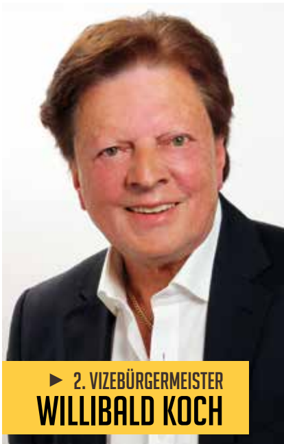
► 2. VIZEBÜRGERMEISTER WILLIBALD KOCH

Aus den Referaten Finanzen, Wirtschaft und Stadtmarketing